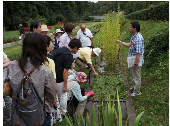
昨年度の「水生植物観察会」の風景